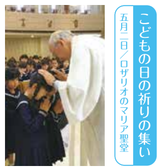
こどもの日の祈りの集い 五月二日/ロザリオのマリア聖堂