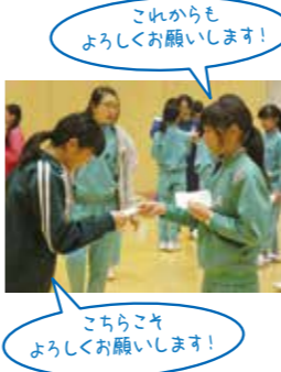
これからよろしくお願いします！ こちらこそよろしくお願いします！

私は新入生合宿でたくさん友達ができました。今、とても楽しく学校生活を送っています。これからも友達と協力し、良い一年にしたいと思います。