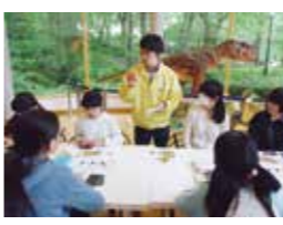
こちらこそよろしくお願いします！

エコトレッキングでは、いろいろな植物や自然の大切さを学ぶことができました。最初は登るのに苦労しましたが、だんだん慣れてきました。自然教室に行く前はエコトレッキングのことが不安でしたが、実際にやってみて楽しかったです。白百合の森づくりでは私たちの班は花壇をつくりました。思ったよりも大変でしたが、皆で協力して三つの花壇をつくり上げることができました。皆と協力して何かをすることはとても大事なことで、終わった時の達成感が一人の時よりも多いことを実感しました。第一次産物体験ではマツボックリや折り鶴を炭で焼いたりしました。炭は生活の中で大切な物だと知り、とても良い経験になりました。民泊先はレストランを経営しているお宅でした。皆で山菜を探りに行ったり、まめぶをつくりたりして、楽しく過ごせました。琥珀採掘は雨のため、勾玉づくりをしました。なかなか上手にはできませんでしたが、自分なりに頑張ったと思います。自然教室で学んだたくさんあることをこれから生活に活かしていきたいです。