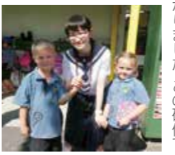
こちらこそよろしくお願いします！

言葉が通じず困ったこともたくさんありましたが、友人と助け合いながら過ごした十三日間は私にとって一生忘れられない思い出となりました。この研修で学んだことを、これからの生活に生かしていろいろなことにチャレンジしていきたいです。