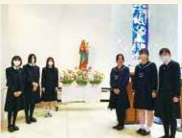
▲5月聖母マリアを讃える集い(5月8日)